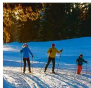
D'immenses circuits.

Les Rousses compte 220 kms de pistes de ski de fond, un des plus beaux domaines de France, sur le plateau et les monts doux qui l'entourent. Guidés par Dominique, le moniteur de l'ESF (Ecole du ski français), nous nous y sommes essayés dans la forêt du Risoux. Dominique a l'art de mettre petits et grands à l'aise et d'expliquer le pas, la glisse, les virages et... le freinage (ainsi que l'art de se relever). Deux heures d'un cours plein de bonne humeur suffisent largement à apprendre les rudiments de ce sport exigeant. Le ski de fond, pour les débutants, est également moins impressionnant que le ski alpin et ses pentes parfois bien raides. Et il peut facilement se pratiquer dans nos régions. Mais surtout, le ski nordique, aux Rousses, c'est une véritable immersion dans un environnement ma-